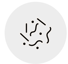
Infektion über Blut und Gewebe