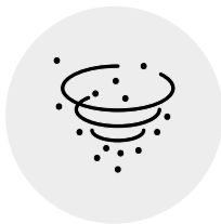
Infektion über Tröpfchen und Partikel aus der Luft