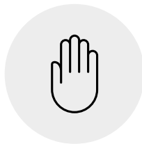
Kontakt-, bzw. Schmierinfektion